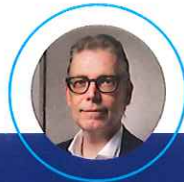
Sindaco Alessandro Bolis