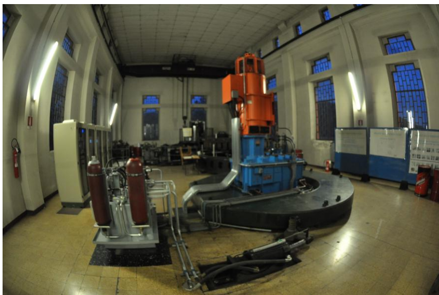
centrale idroelettrica di San Lazzaro a Bassano

Per quanto infine concerne la biodiversità, oltre alle specifiche azioni messe in atto dal Consorzio per la salvaguardia degli ambiti naturali esistenti e per crearne di nuovi, risulta molto importante l'effetto dello scorrimento dell'acqua nella rete dei canali. Il microclima favorevole che si genera negli alvei dei canali, attraverso l'evaporazione e le infiltrazioni al suolo, favorisce sia lo sviluppo della flora spontanea sia il mantenimento e la crescita delle specie presenti